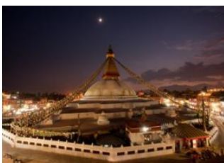
Katmandou (1330 m) 📍