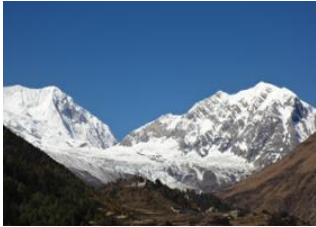
Lungdang (3200m) 📍 17km - ⌚ 7h Lokpa (2240) 📍