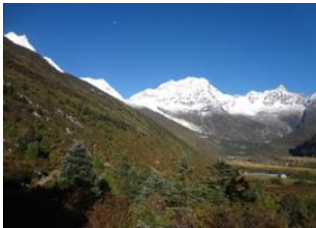
Lokpa (2240) 📍 11km - ⌚ 5h Deng (1860 m) 📍