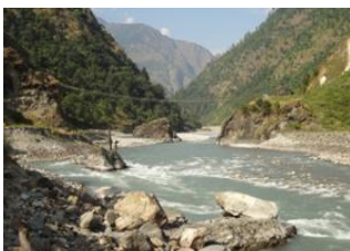
Katmandou (1330 m) 📍 🚗 150km - ⌚ 8h Lapubesi (884m) 📍