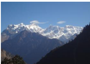
Deng (1860 m) 📍 17km - ⌚ 7h Namrung (2630 m) 📍