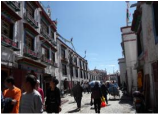
Lhasa (3650 m) 📍