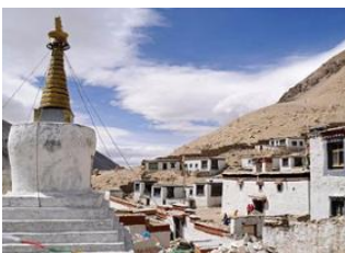
Shigatse (3900 m) 📍