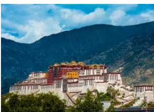
Lhasa (3650 m) 📍