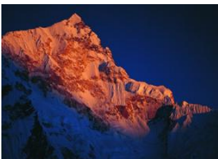
Lhasa (3650 m) 📍