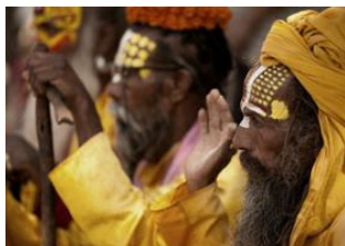
Katmandou (1330 m) 📍