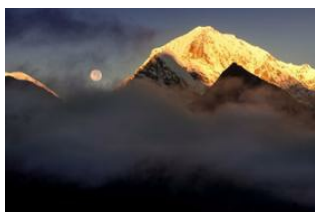
Monjo (2835 m) 📍 6km - ⌚ 4h Namche (3440 m) 📍