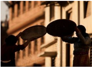
Katmandou (1330 m) 📍