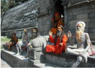
Katmandou (1330 m) 📍