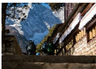
Namche (3440 m) 📍 9km - ⌚ 4h Thame (3800 m) 📍