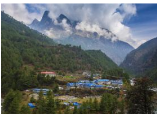
Kongde (4200 m) 📍 10km - ⌚ 5h Phakding (2610 m) 📍