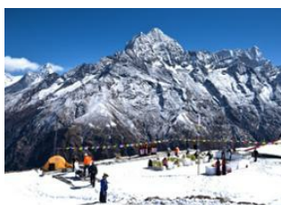
Thame (3800 m) 📍 13km - ⌚ 7h Kongde (4200 m) 📍