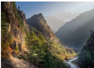
Katmandou (1330 m) 📍