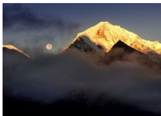
Phakding (2610 m) ↴

6km - ⌚ 2h Monjo (2835 m) ↴ 6km - ⌚ 4h Namche (3440 m) ↴