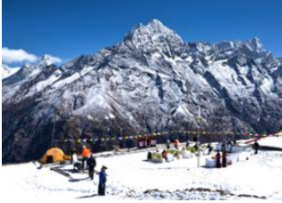
Thame (3800 m) 📍 13km - ⌚ 7h Kongde (4200 m) 📍