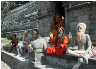
Katmandou (1330 m) 📍