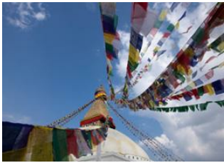
Katmandou (1330 m) 📍