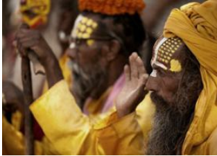
Katmandou (1330 m) 📍