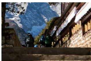
Namche (3440 m) 📍 9km - ⌚ 4h Thame (3800 m) 📍