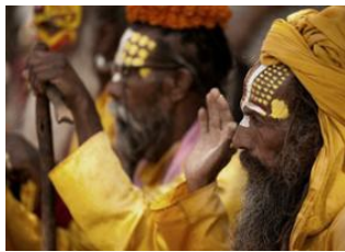
Katmandou (1330 m) 📍