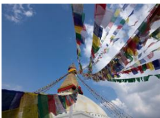
Chitwan National Park (180 m) 98km - 6h Katmandou (1330 m)