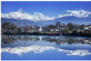
Pokhara (820 m) 📍