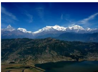
Pokhara (820 m) 📍