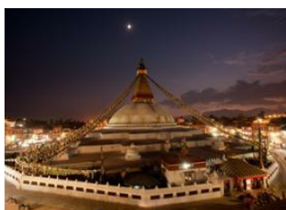
Katmandou (1330 m) 📍