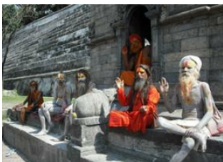
Katmandou (1330 m)