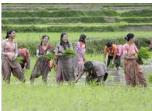
Pokhara (820 m) 📍

🚗 84km - ⌚ 5h Chitwan National Park (180 m) 📍