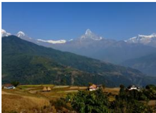
Dhampus (1650 m) 📍