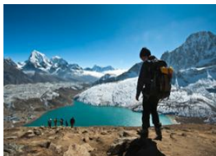
Gokyo (4790 m) 📍