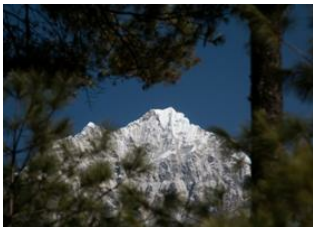
Lukla (2850 m) 📍