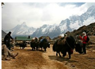
Phortse (3810 m) 📍