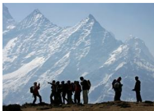
Phanga (4400m) 📍