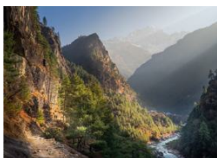
Phakding (2610 m) 📍