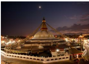
Lukla (2850 m) 📍 ✈️ 150km - 🕒 30m Katmandou (1330 m) 📍