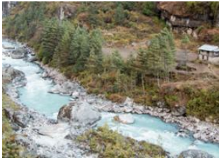
Namche (3440 m) 📍