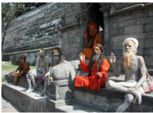
Katmandou (1330 m) 📍