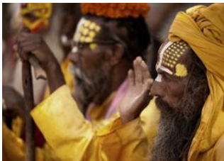
Katmandou (1330 m) 📍