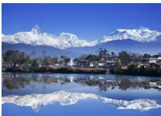
Katmandou (1330 m) 📍 🚗 200km - ⌚ 6h Pokhara (820 m) 📍